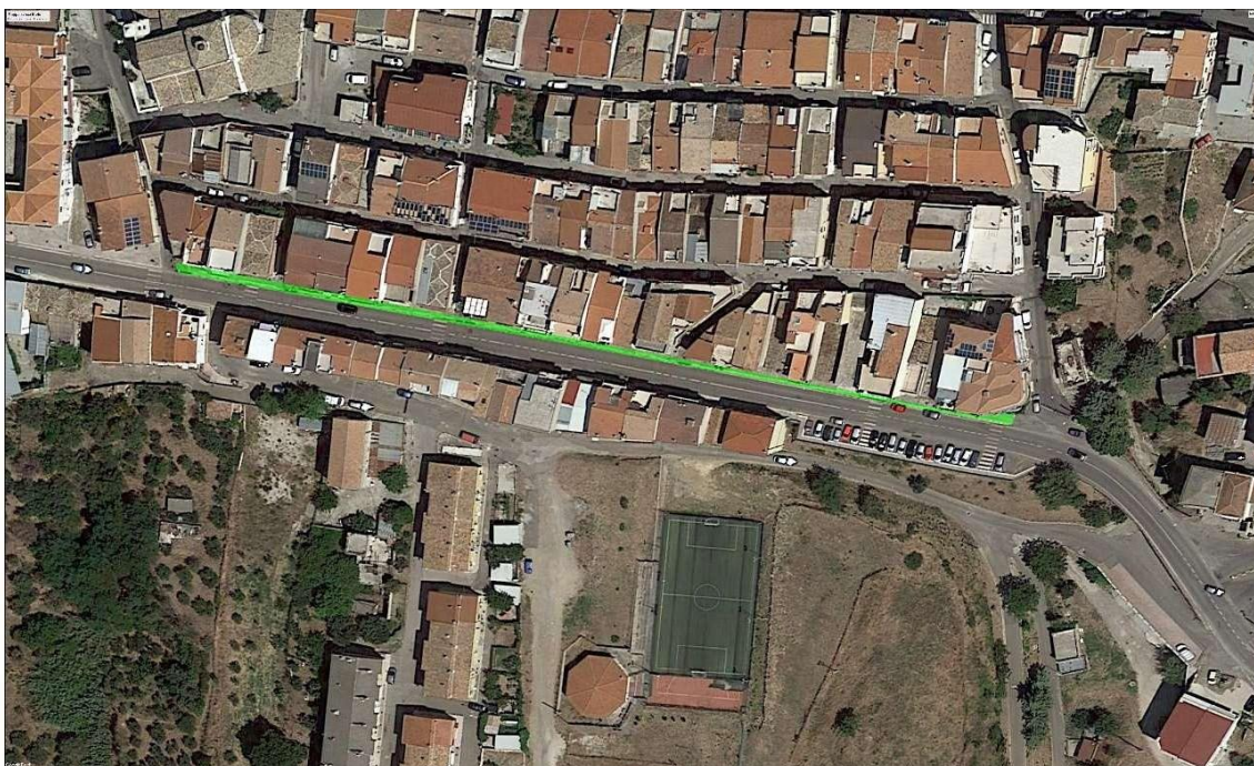
Figura 11 – Ortofoto area di intervento

Tale area risulta caratterizzata da una significativa presenza di flussi pedonali ed al contempo da numerosi accessi carrabili che sollecitano, con il prolungato passaggio veicolare, la struttura stessa dei marciapiedi.