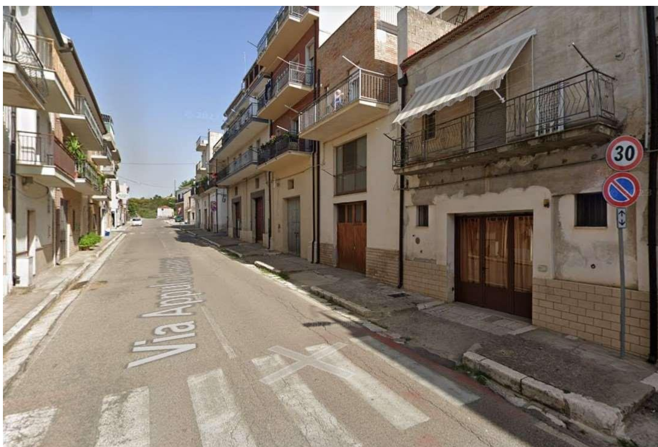
Figura 8 - Stato di fatto dei marciapiedi lungo la S.P. 1 nell'abitato di Grassano