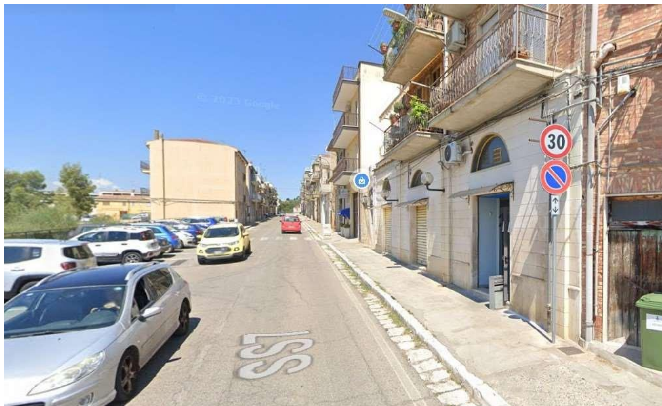
Figura 3 – Stato di fatto dei marciapiedi lungo la S.P. 1 nell'abitato di Grassano

Risultano pertanto necessari ed urgenti degli interventi di natura più consistente e preventiva, sia per evitare condizioni di peggioramento nel tempo, sia per garantire quanto prima la percorribilità in sicurezza dei tratti di marciapiede interessati da fenomeni di ammaloramento e dissesto.