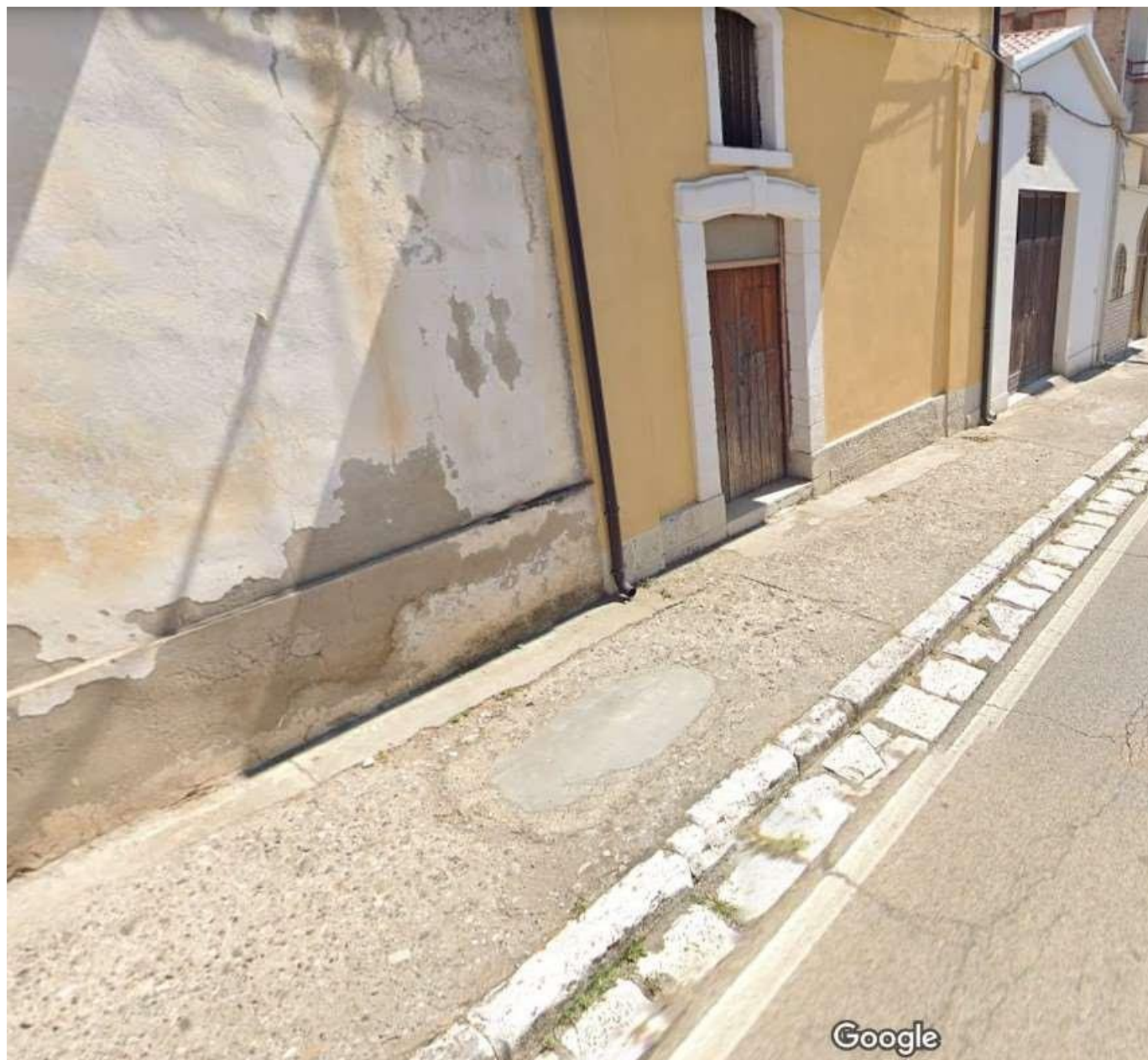
Figura 9 - Stato di fatto dei marciapiedi lungo la S.P. 1 nell'abitato di Grassano