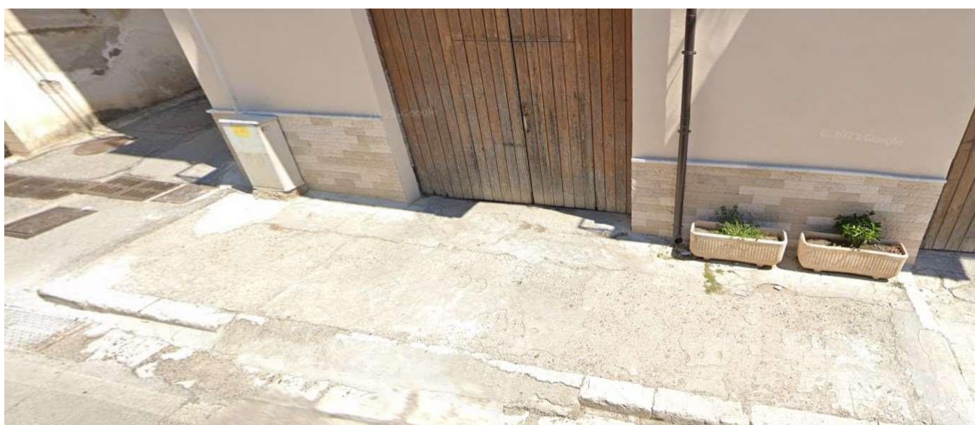
Figura 6 - Stato di fatto dei marciapiedi lungo la S.P. 1 nell'abitato di Grassano