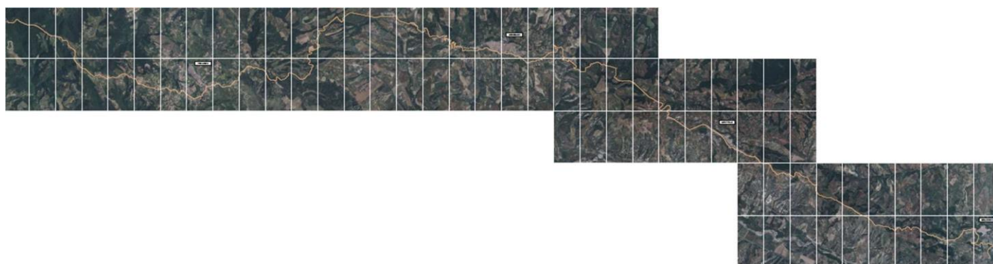
Figura 2 – Ortofoto