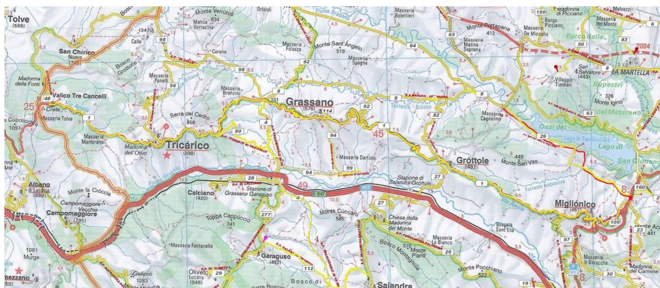
Figura 1 – Ubicazione S.P. 1

Come detto la S.P. 1 attraversa i comuni di Miglionico, Grottole, Grassano e Tricarico e in tali aree assume una conformazione di strada urbana a tutti gli effetti, con la relativa presenza di marciapiedi, e servizi tipici delle strade interne ad un abitato.