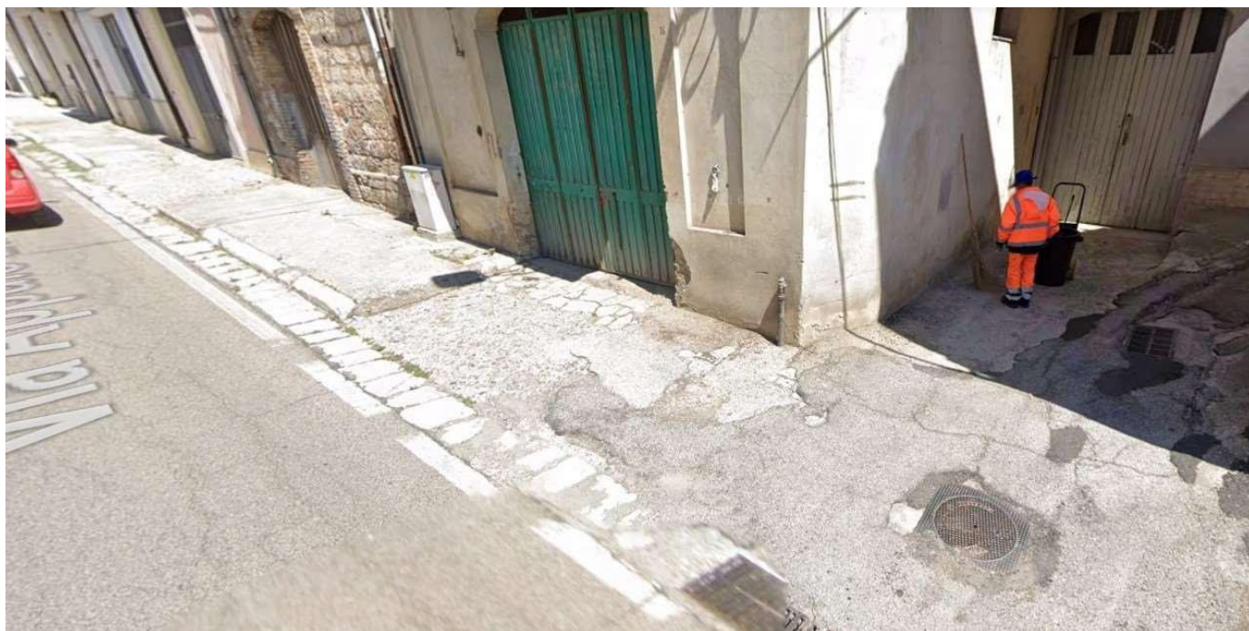
Figura 7 - Stato di fatto dei marciapiedi lungo la S.P. 1 nell'abitato di Grassano