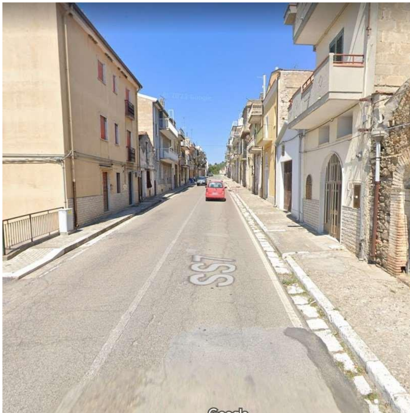
Figura 4 - Stato di fatto dei marciapiedi lungo la S.P. 1 nell'abitato di Grassano